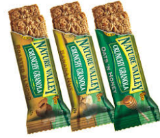
la merienda nutritiva