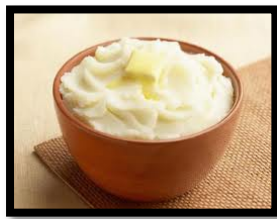
el puré de papas