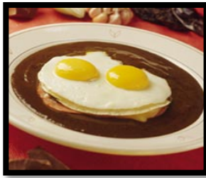
los huevos estrellados