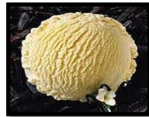
el helado de vainilla