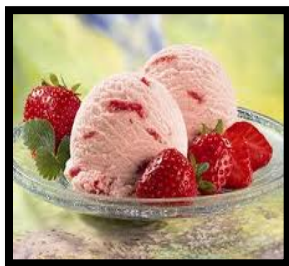
el helado de fresa