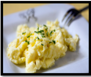
los huevos revueltos