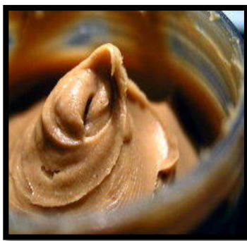
la crema de cacahuete