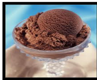
el helado de chocolate