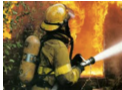
el bombero, -a