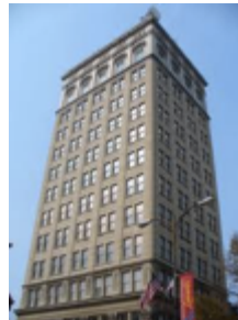
el edificio de