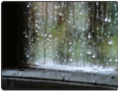
llover ( o → ue )