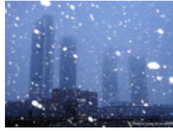
nevar ( e → ie )