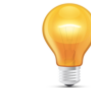
la luz pl. las luces