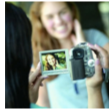
hacer un video