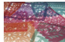
el papel picado