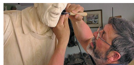
el / la escultor(a)