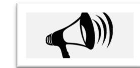
sonar (ue) (a)