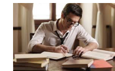
el / la escritor(a)