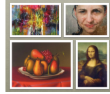
los géneros de arte