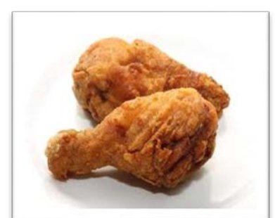
el pollo frito