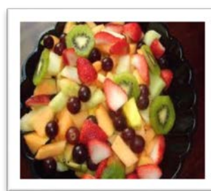
la ensalada de frutas