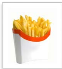
las papas fritas