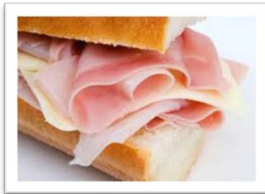
el sándwich de jamón y queso