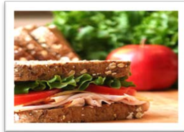
el almuerzo saludable