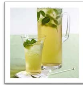
el té helado