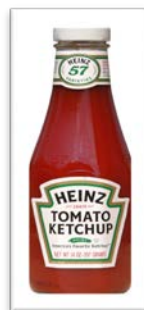
la salsa de tomate