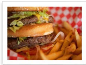
la comida grasosa